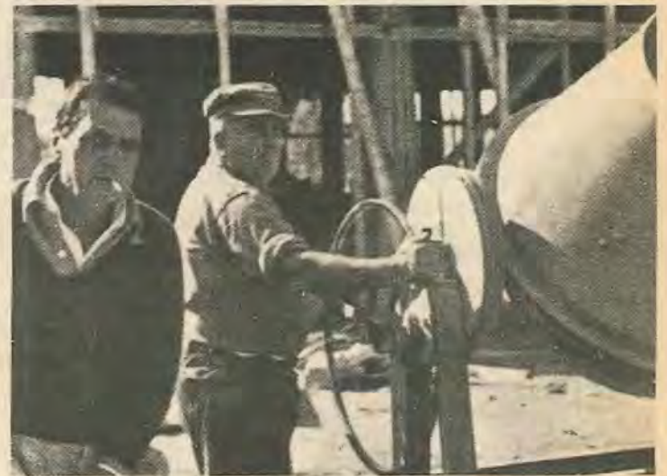
του κράτους θα είναι η επίλυση του μεγάλου κοινωνικού προβλήματος της στέγης που

Από την άλλη, σε διάφορες περιπτώσεις, ή μονοπωλική διάρθρωση της αγοράς, όπως στην περίπτωση των τιμμένων, οδηγεί στο σκόπιμο περιορισμό της παραγωγής. Περιορίζοντας την παραγωγή οι εταιρείες μπορούν να εξασφαλίζουν περισσότερα κέρδη, (λόγω της αύξησης που αυτό προκαλεί στις τιμές) από μια μικρότερη παραγωγή παρά από μια μεγαλύτερη. Το κράτος δεν θα έχει το κίνητρο του κέρδους, και θα παράγει το μέγιστο με τον πιο ορθολογιστικό τρόπο. Σκοπός